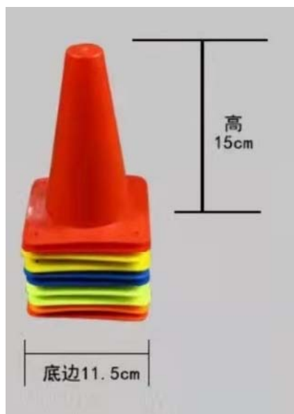
图 2：障碍物形状与尺寸